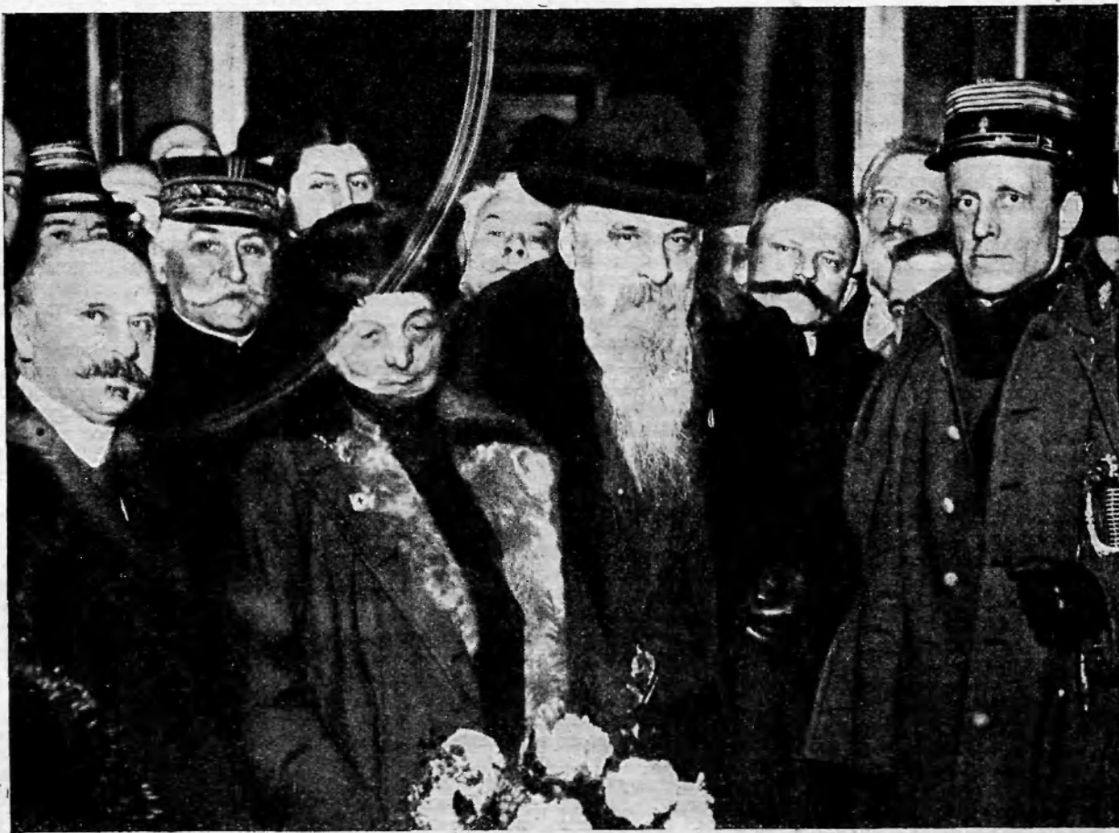
ГЕН. РИЧЧИОТТИ ГАРИБАЛЬДИ.