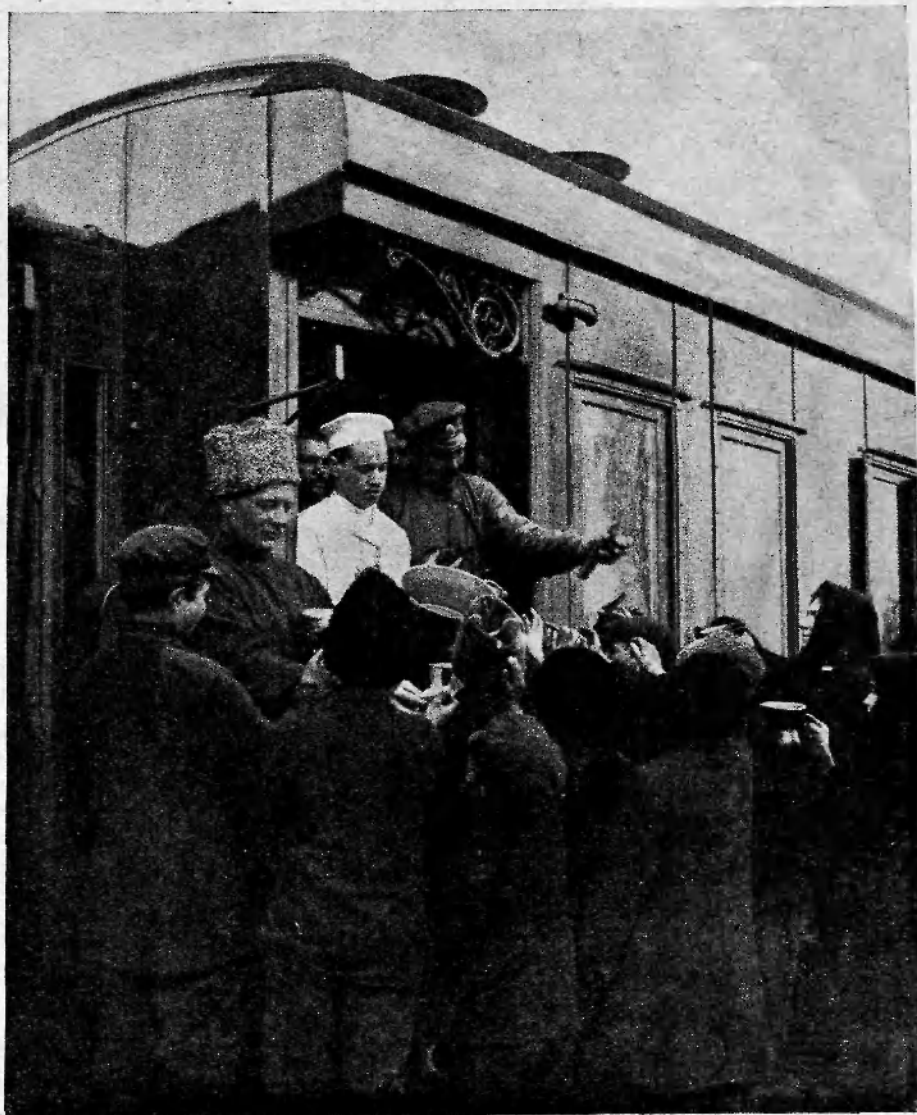
РАЗДАЧА ХЛѢБА БѢДНОМУ НАСЕЛЕНІЮ.