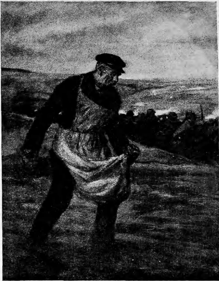
Рис. Люсьенъ Жонасъ.

И сердце Отто трепыхало въ груди отъ радости.