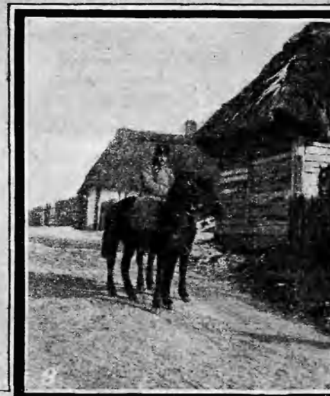
Хроника войны: 1. Походная хлѣбопекарня въ г. Радомѣ. — 2. Встрѣча казаксъ-одностаничниковъ. — 3. Питательный пунктъ подвижн. высотъ по картѣ. — 5. Во время отдыха, у землянокъ на передовыхъ позицияхъ. — 6. Братскія могилы у ст. Новая Александрія. — 7. Г.