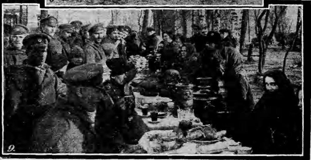
лада Ея Имп. Велич. Госуд. Имп. Александры Теодоровны на ст. Скаржиска. Раздача горячей пищи солдатамъ. — 4. Топографическая повѣрка ст. Опочно. Бѣженцы изъ разоренныхъ мѣстечекъ. — 8. Мѣстечко Сиховъ-Дуже, вблизи австрійской границы. — 9. На базарѣ, на ст. Кѣльцы.