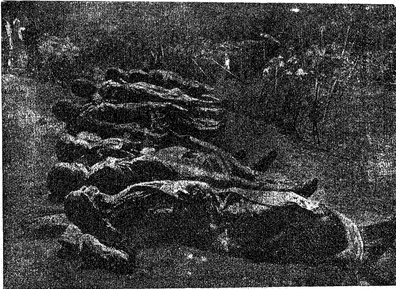
Русскія женщины, замученныя пруссаками.

Пройдетъ война, будутъ брошены и отчасти забыты газеты, но пусть у каждого русского чело-