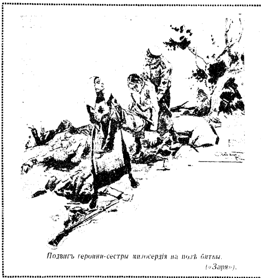
Подвигъ героини-сестры милосердія на полѣ битвы.