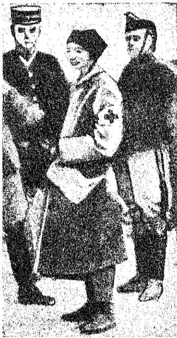
Англичанка-санитаръ на передовыхъ позиціяхъ.

Въ бесѣду вступаетъ очень охотно. Вотъ исторія послѣднихъ дней ея жизни.