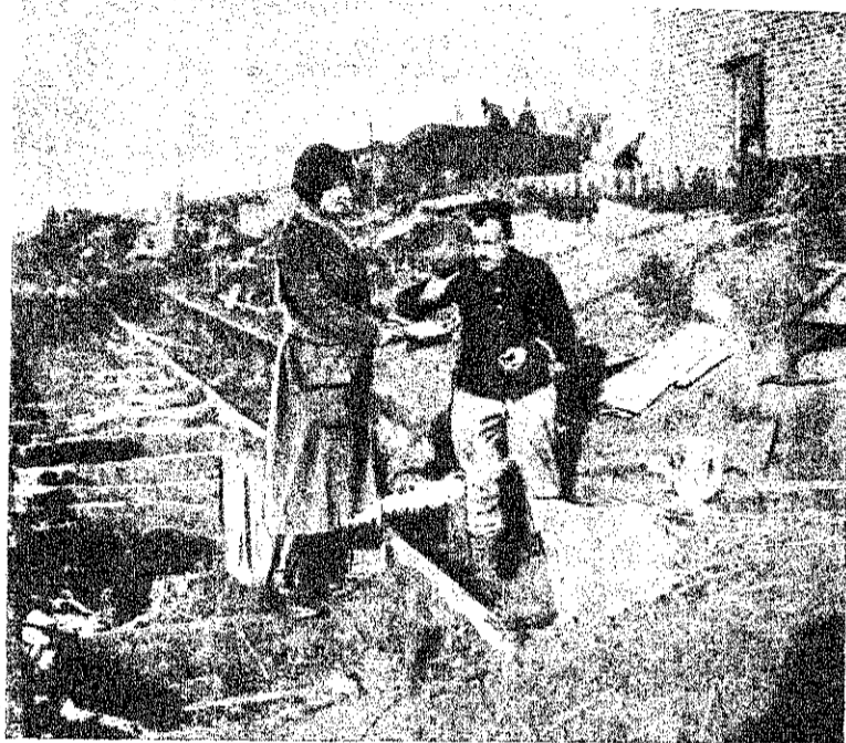
Англичанка—военная корреспондентка на передовыхъ позиціяхъ угощаетъ шоколадомъ французскаго солдата.