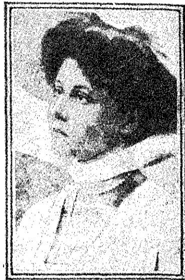
Бельгійская героиня Фежо, соб- ственноручно убившая двухъ прус- саковъ, пытавшихся совершить надъ ней насиліе.