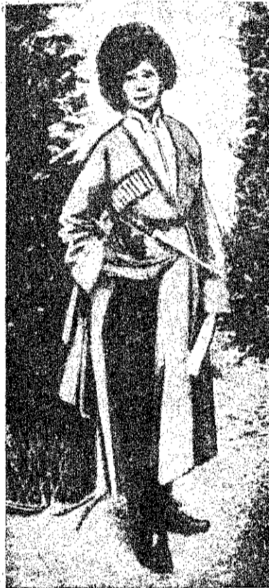
Первая русская женщина на театрѣ военныхъ дѣйствій.

Ходатайство это встрѣтило полное сочувствіе станичниковъ и окружающихъ.