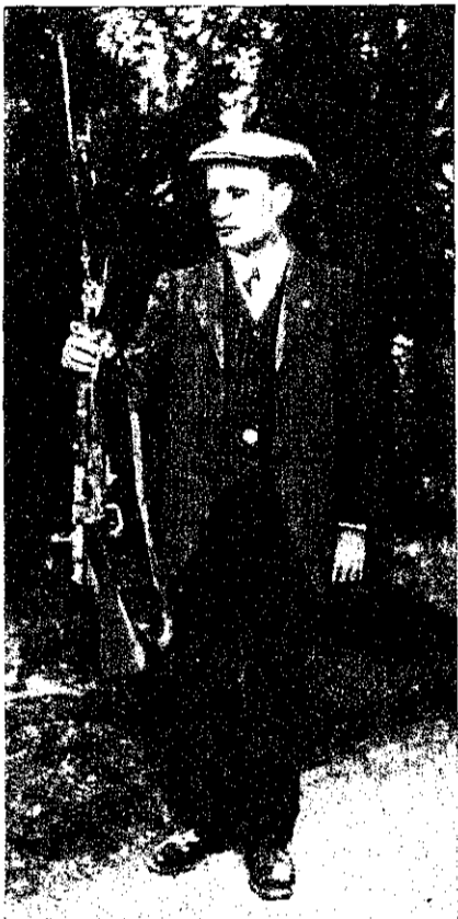
Рис. 9. Бенъ Тиллетъ, лидеръ лондонскихъ рабочихъ.

Ллойдъ Джорджъ принялся за работу съ необыкновеннымъ азартомъ. Онъ зажечь энтузіазмомъ всю страну. Въ Лондонѣ, въ Ливерпулѣ, въ Ман-