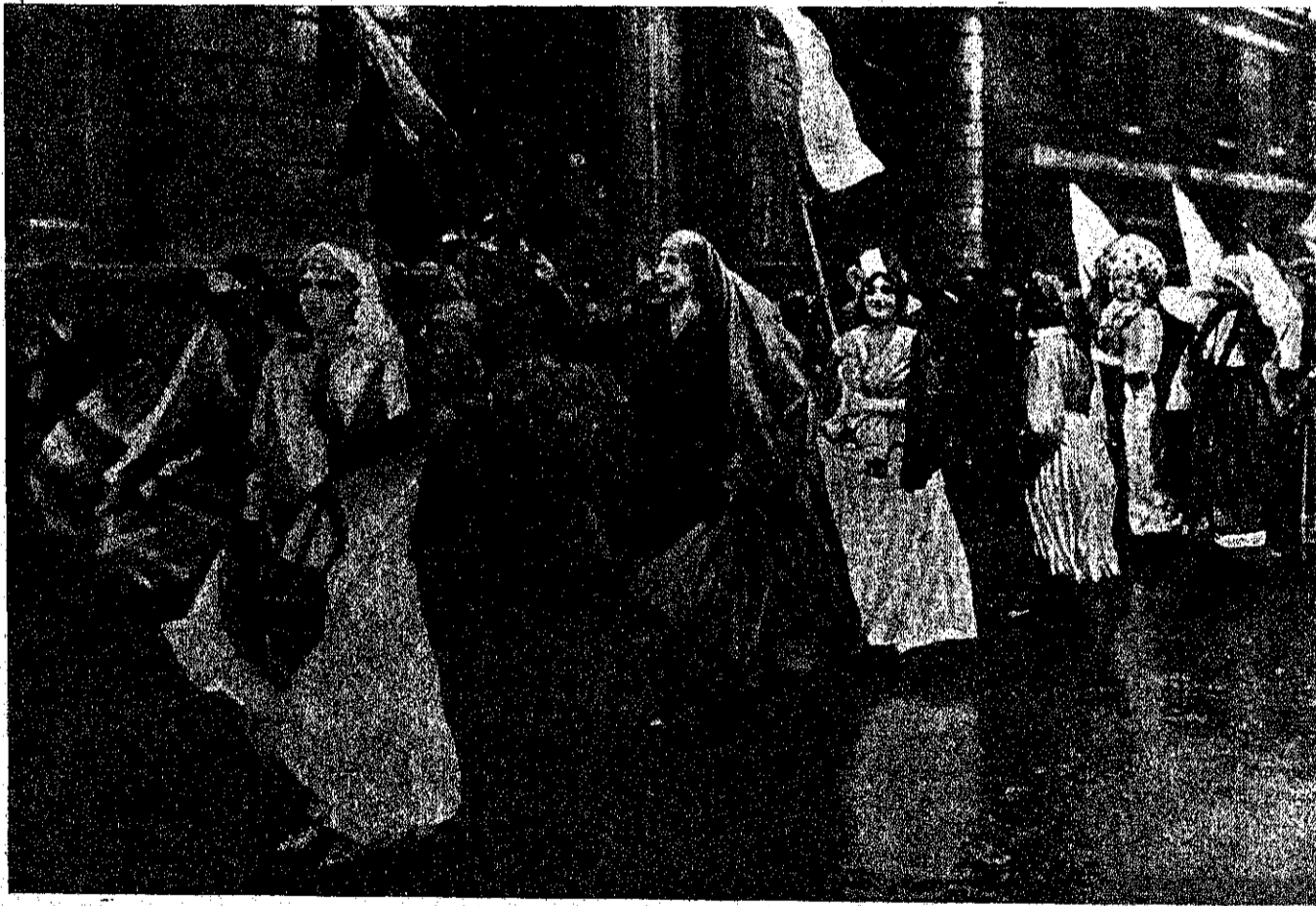
Рис. 6. На улицахъ Лондона. Процессія английскихъ женщинъ, выразившихъ желаніе работать на снаряженіе армии.