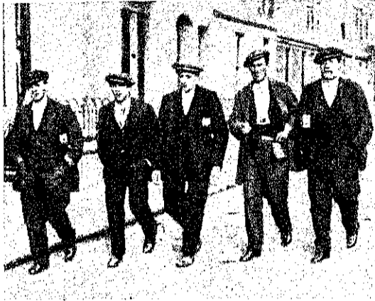
Рис. 5. Вольная дружина лондонскихъ клерковъ отправляется на Вульвичскій казенный оружейный заводъ.

Дѣло пошло и совсемъ хорошо, когда въ ихъ дружину вошли инженеры, машинисты, механики.