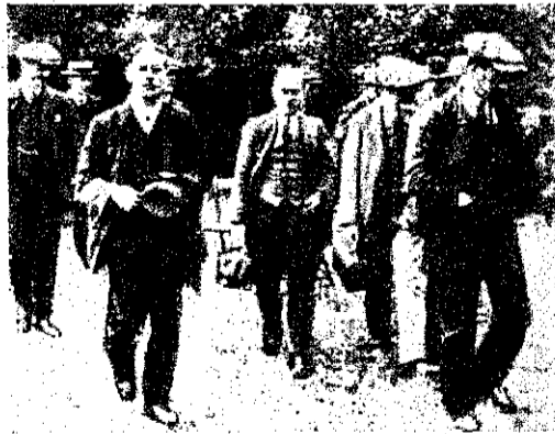
Рис. 4. Клоуны и прочіе артисты цирка по пути на оружейный заводъ.