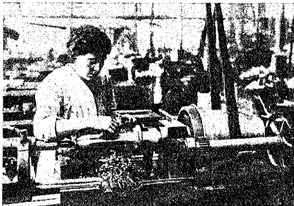
Рис. 13. Французскія женщины изготовляютъ снаряды.

Ллойдъ Джорджъ принялъ депутацію дружески, поблагодарилъ за великодушный порывъ, которого страна не забудетъ, поговорилъ о насущныхъ дѣлахъ и, взявъ съ