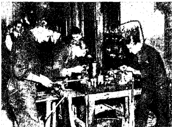
Рис. 2. Лондонскіе студенты-технологи изготовляютъ у себя въ мастерскихъ части военныхъ гидроплановъ.

Но старуха не уходитъ, стоитъ. Она хочетъ своими руками изготовить гранату, ядро или пулю противъ того, кто убилъ ея сына. Она словно не замѣчаетъ привратника и, какъ сомнамбула, повторяетъ одно: — Изъесть убилъ моего сына. Нужно ему отплатить.