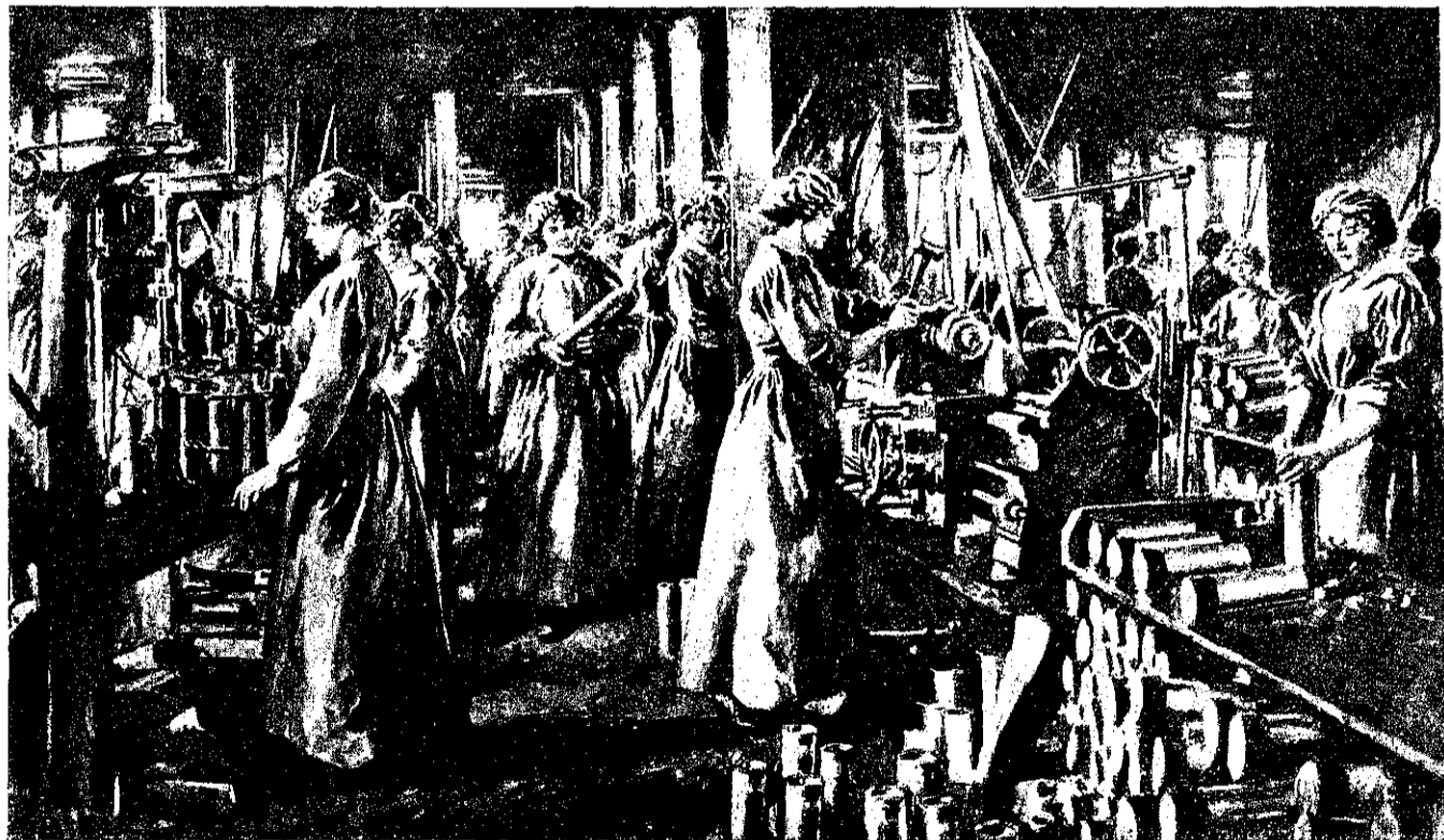
Рис. 8. Английскія женщины за изготовленіемъ снарядовъ для армии.