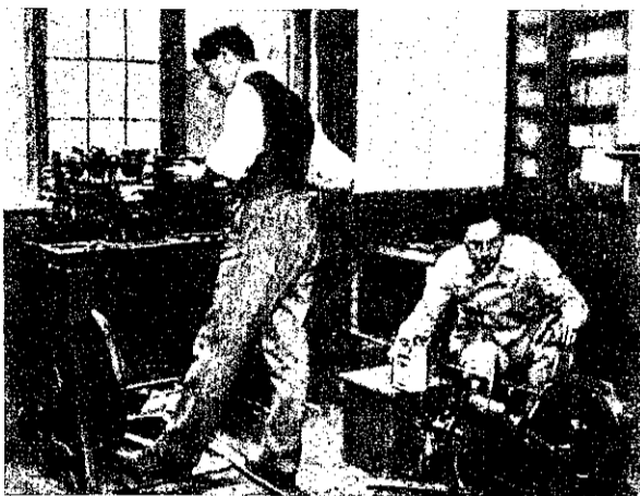
Рис. 1. Ризница, обращенная въ оружейный заводъ. Священникъ за рабочимъ станкомъ надъ отдѣлкой снаряда.