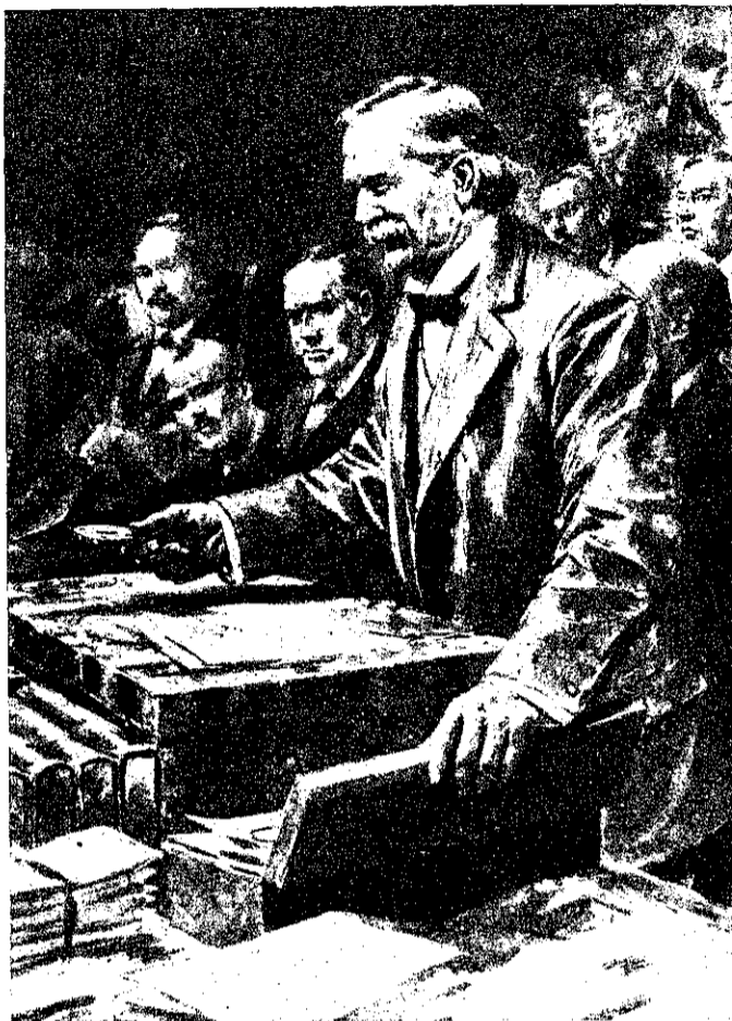
Рис. 10. Ллойдъ Джорджъ въ парламентѣ.