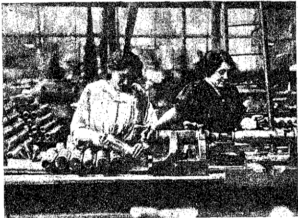
Рис. 12. Французскія женщины изготовляют снаряды.

честерь, передь огромными толпами, онъ кричалъ: