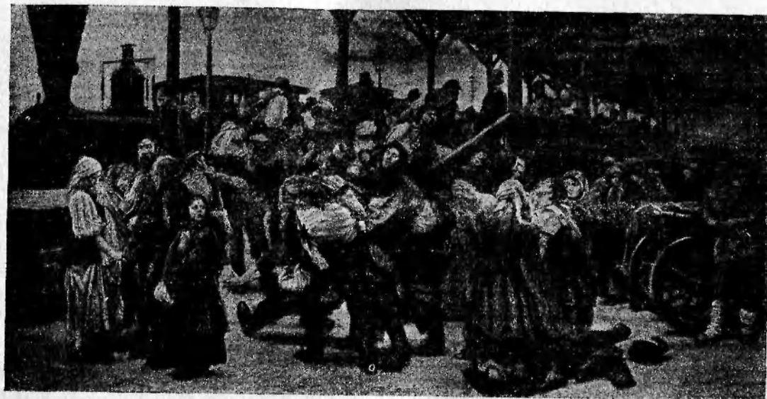
К. А. Савицкий.