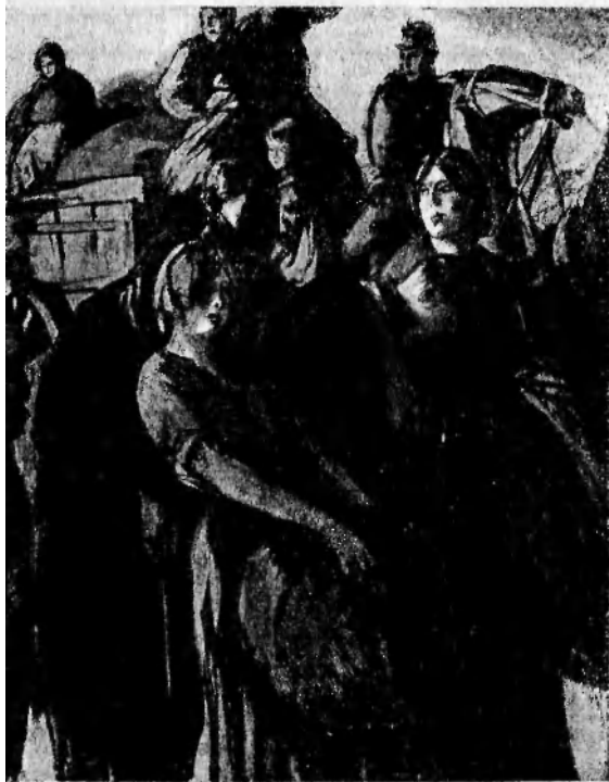
Разоренная и бездомная Бельгия.